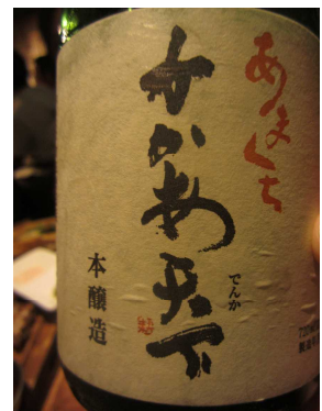
群馬県産の日本酒を提供