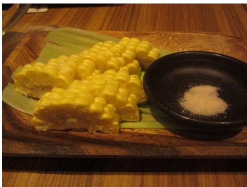
孺恋村産の生とうもろこし