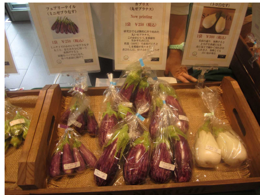
人気のなす品種をPR