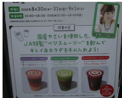
「野菜スムージー」紹介