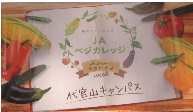
「JAベジカレッジ」代官山キャンパス

さらに「やさいデザイン学科」ではガラスの小瓶に専用オイルと乾燥した唐辛子・トウモロコシ・オクラ等様々な乾燥した野菜を入れインテリアとして楽しむ「ベジハーバリウム」作り体験、「やさいおもてなし学科」では「シソとダイコン香るウォッカトニック」・「ニラと豆乳のピニャコラーダ」等新鮮な国産野菜をふんだんに使用したオリジナル野菜カクテルが販売されました。