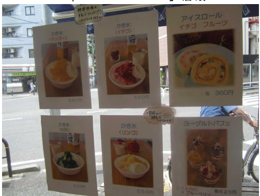
かき氷やヨーグルトパフェにも神津牧場産牛乳を使用