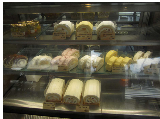
様々なロールケーキ