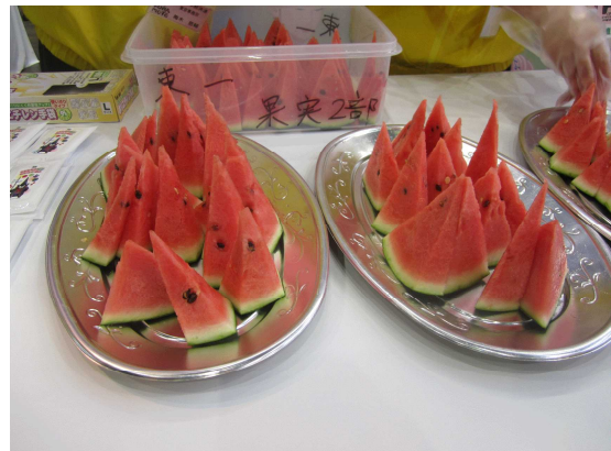
試食提供用のすいか