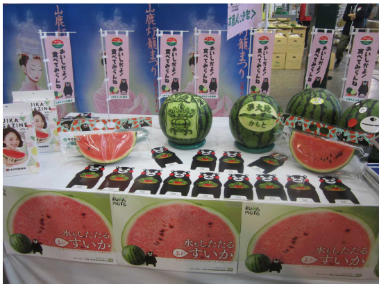
JA鹿本産のすいかをPR

山鹿市やJA鹿本から「当産地は日本一の生産量を誇っています。年明けの低温で生育が心配されましたが、生産者の高い技術力により品質良好で食味の良いすいかが出荷されており、5月のピークに向けて日々増量しています。6月まで出荷されるので販売の方をよろしくお願ひします。」と挨拶がありました。